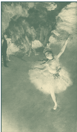
Danseuse sur la scène , Edgard Degas

La gran Rosita dejó la escena parisina en 1898. Su última actuación fue con la obra L'Etoile , de Andrée Wornser en el Teatro de la Ópera en 1897. Desde entonces hasta ahora ha continuado vinculada al ballet y la danza. Todos los grandes bailarines y bailarinas del primer cuarto de siglo en Europa han pasado por sus manos en la escuela de la ópera y el conservatorio de París.