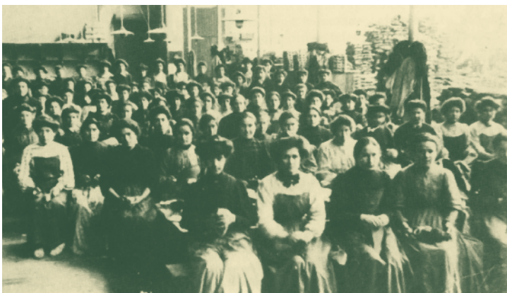
Foto: 150 ans d'Espadrille á Mauléon